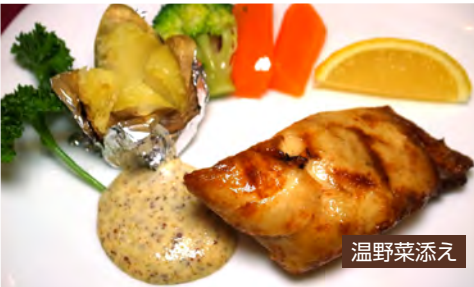
Grilled Fish of The Day