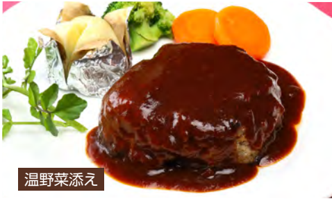
Matsusaka Beef Hamburger Steak