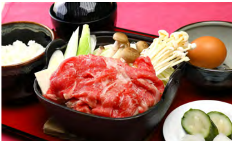
Parma Ham and Seasonal Vegetable Salad