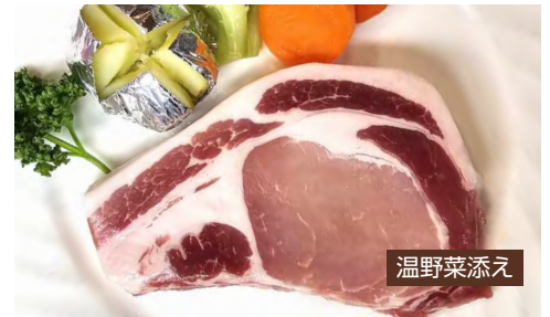
Kurobuta Pork Steak