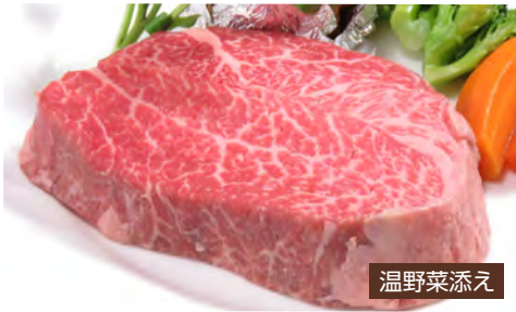
Matsusaka Beef Steak Lunch