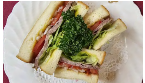
Sandwich Roast Matsusaka Beef