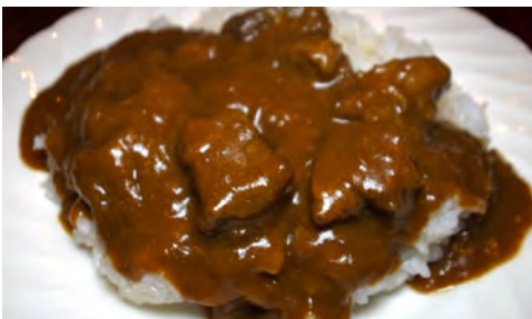
Matsusaka Beef Curry Rice