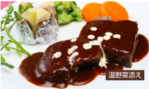
Stewed Matsusaka Beef