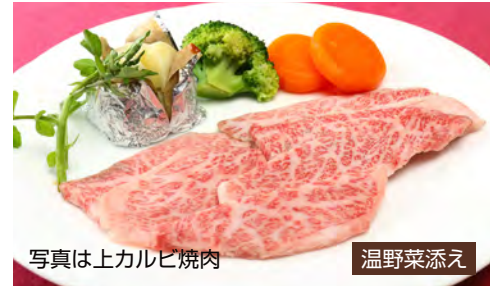
Matsusaka Beef Yakiniku, Karubi Yakiniku